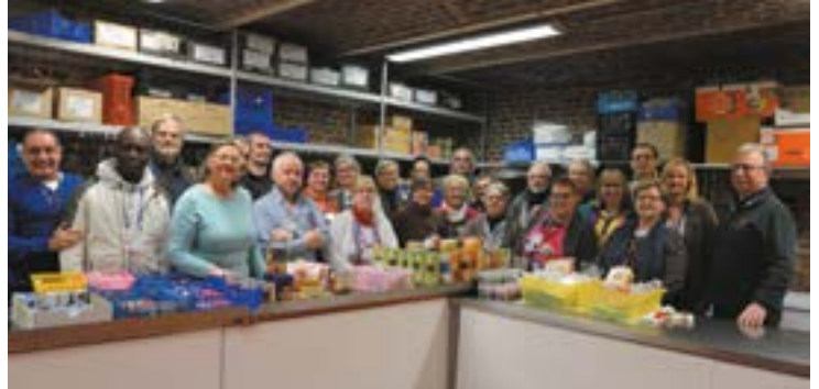
L'équipe des bénévoles du centre Dupire au (presque) grand complet.

Au centre Pasteur, une vingtaine de bénévoles distribue 750 repas par semaine, pour 45 familles. «Un chiffre stable, avec une évolution : de plus en plus de mères seules viennent nous voir...», constate Béatrice Delobel, responsable.