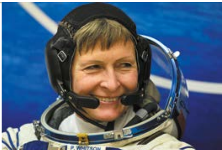
L'astronaute américaine Peggy Whitson est la femme ayant passé le plus de temps en orbite.