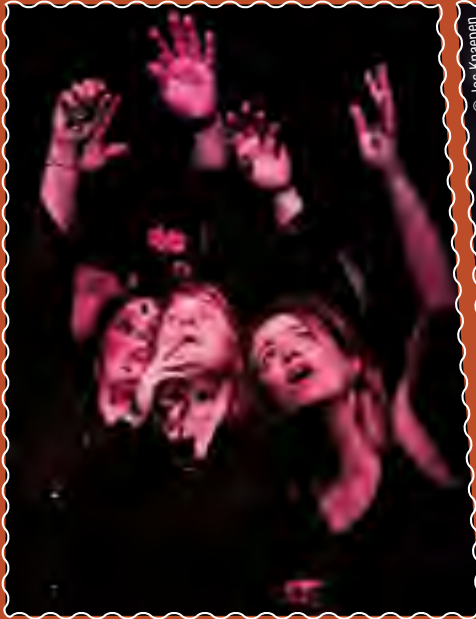
Le 16 mars, C'est quoi ce jeu , à la ferme Dupire.