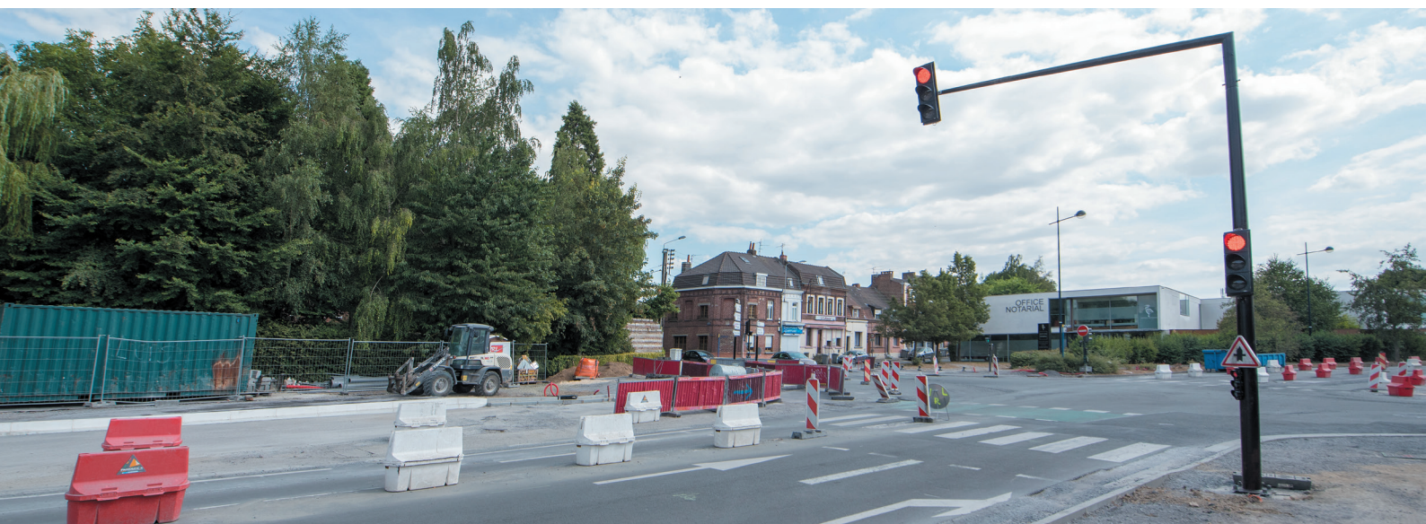
Travaux à l'angle de la rue du 8 Mai 1945 et du boulevard Montalembert

4 - Les conseillers de quartier s'engagent dans le cadre d'une mission volontaire et bénévole, à honorer leur mandat exclusivement dans l'intérêt général. Cette mission est incompatible avec la recherche d'un intérêt personnel de quelque nature que ce soit. 5 - Cet engagement qui sera formalisé par la signature de la charte et du règlement intérieur, nécessite une disponibilité pendant toute la durée du mandat.