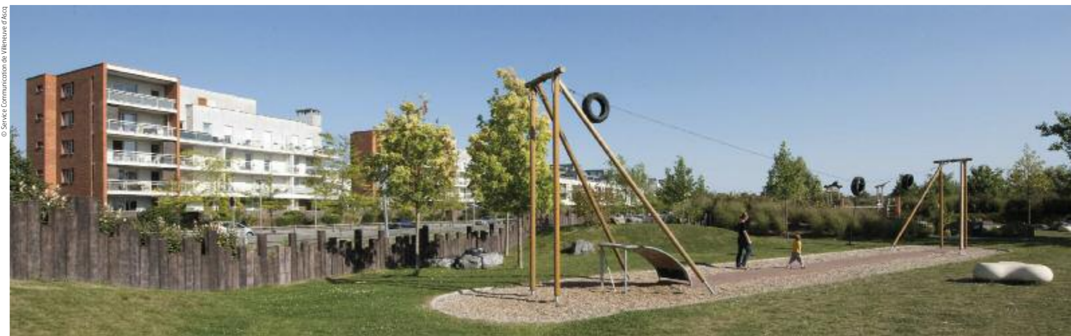
Le quartier de la Haute-Borne, nouveau centre économique de la nouvelle ville, conjugue habitat et activités.

Quatrième ville de la métropole lilloise par sa population, Villeneuve d'Ascq en est le deuxième pôle économique !