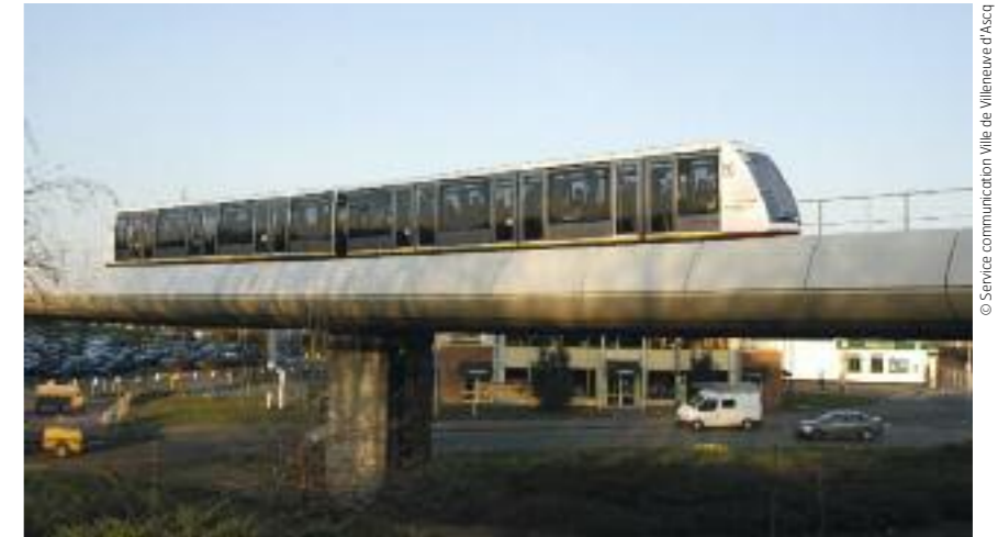
Le lien VAL automatique entre Lille et la ville nouvelle est devenu le métro lillois.

(Info-com) sur la participation des habitants. Villeneuve d'Ascq a en quelque sorte été un laboratoire de ces politiques bien avant qu'elles ne soient développées.