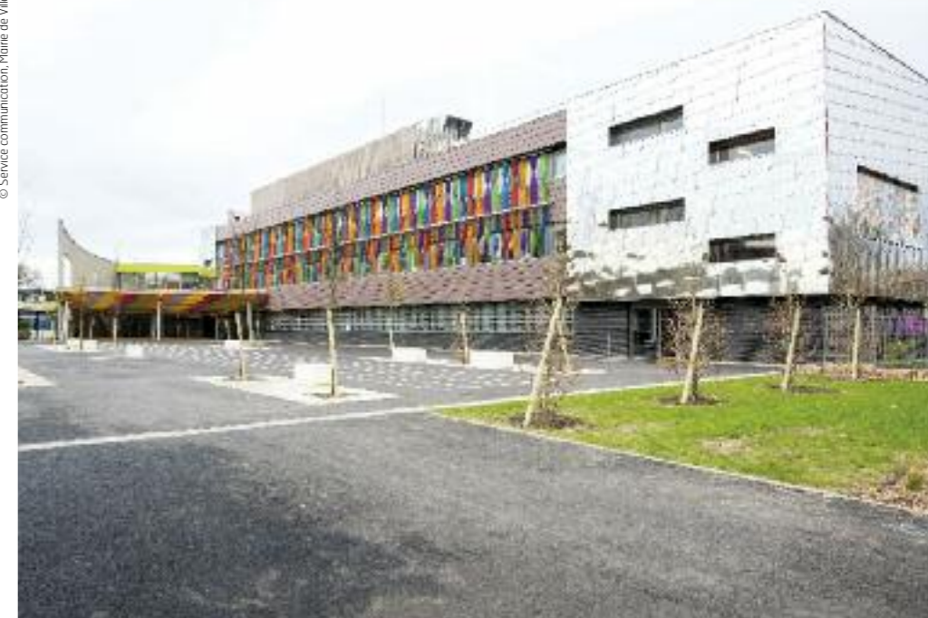
Le groupe scolaire La Fontaine, soumis à l'obligation d'accessibilité comme l'ensemble des Etablissements Recevants du Public (ERP) de la ville.