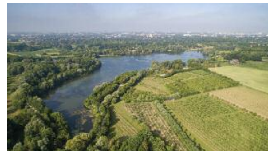
Dès les années 80, la prise en compte des habitants dans l'aménagement urbain, a permis de préserver un espace pour la nature.

Pour ma part, en tant que journaliste, j'ai fait le constat que dans l'aménagement urbain ou la gestion d'une ville, l'apport des habitants est aussi essentiel que celui des décideurs. Cela doit se faire avec eux et non malgré eux. C'est à Villeneuve d'Ascq que j'ai observé cela puis ailleurs, dans d'autres villes, d'autres pays. Leur contribution est essentielle. Je l'ai écrit dans bien des publications et dans un petit livre paru en 1992 "Les habitants aménageurs" (Editions de l'Aube). C'est aussi cette participation active qui m'a amené en 2001 à créer et à diriger la Direction de la démocratie participative et de la citoyenneté au sein de la ville de Lille et d'intervenir l'Université de Lille 3