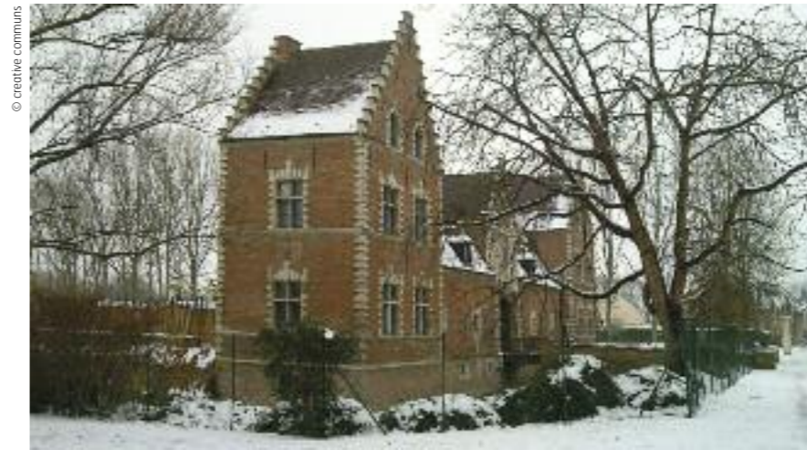
Le château de Flers.