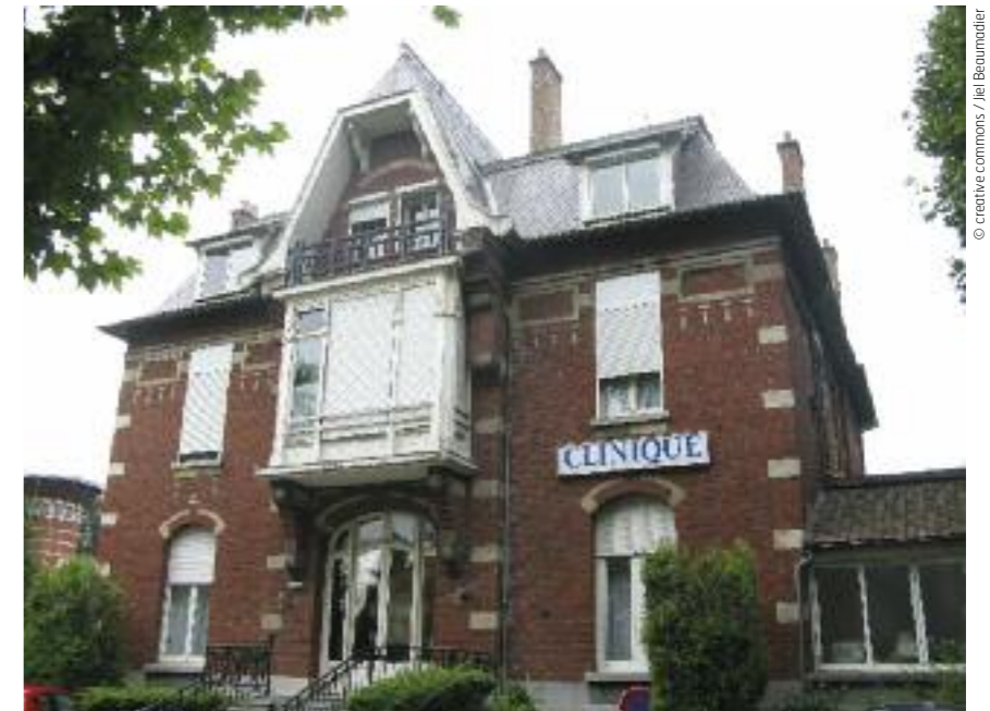
La clinique Jean Varlet : l'un des établissements de santé de Villeneuve d'Ascq.

La Ville mène également une politique de prévention. Et elle verse des subventions aux associations ayant partie liée à la santé des Villeneuvois.