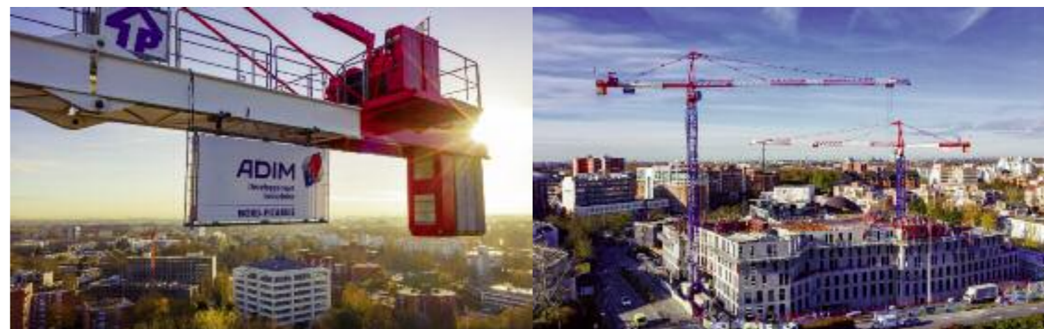
Open'R - Villeneuve-d'Ascq