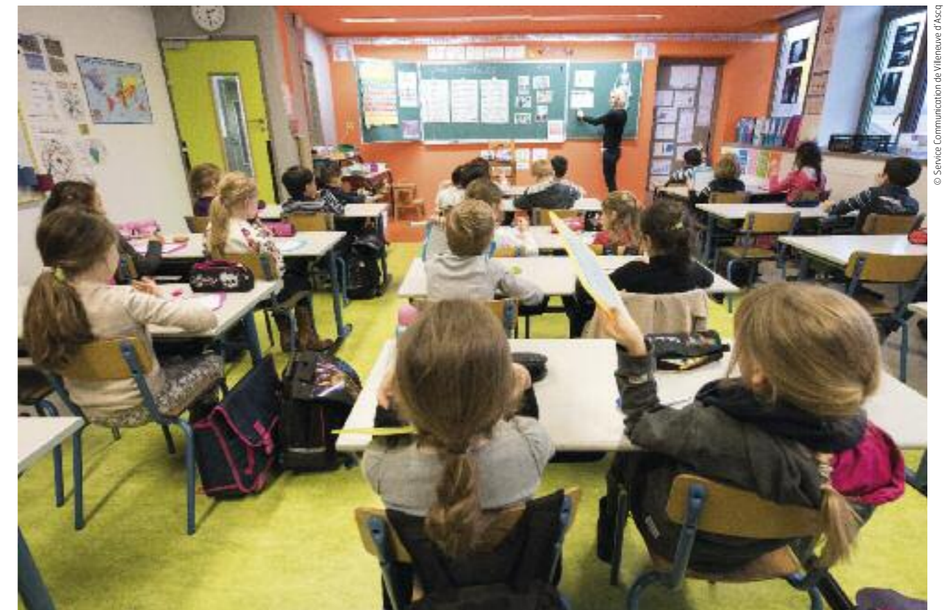
L'une des écoles élémentaires de Villeneuve d'Ascq.

La ville a développé 17 centres permanents d'accueil et de loisirs, implantés à proximité des groupes scolaires. L'accueil