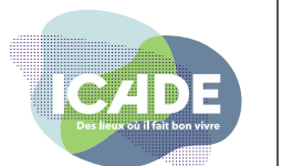
Illustration non contractuelle, à caractère d'ambiance. Appartements et terrasses/balcons vendus non meublés. Nombre et essence des arbres non contractuels. Icade Promotion - Immeuble Open - 27, rue Camille Desmoulins - CS 10166 - 92445 Issy-les-Moulineaux Cedex - SASU au capital de 29 683 456 euros - RCS Nanterre 784 606 576 - N° Oras 13003036 - ICESP Mandataire Non Exclutif - Carte T C P 7501 2016 000 016 385 délivrée par la CCI de Paris.