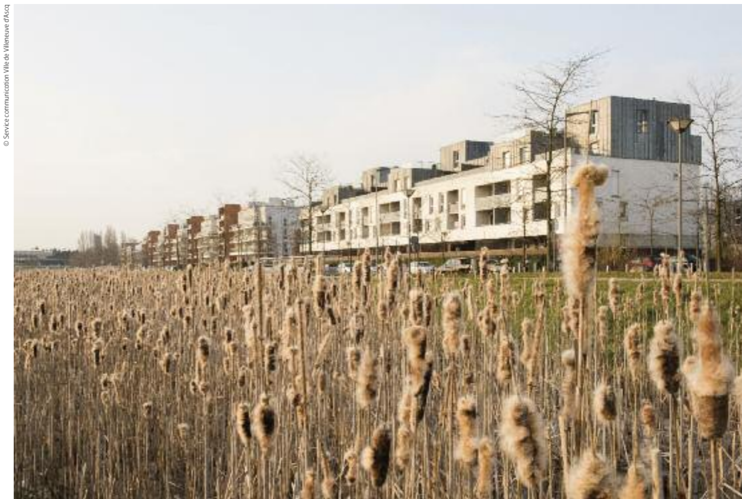
La technopole verte est aujourd'hui une ville en transition, nature et nourricière : arrêt de l'étalement urbain, continuités écologiques et biodiversées et ville nourricière, avec ses jardins partagés, ses circuits courts*.

■ c'est avec les ZAC (zones d'aménagement concerté) du Recueil au nord de la ville, de la Haute Borne au sud et le PLH1 (2005-2011) qu'il y a eu une réelle relance du développement de la ville en matière d'ha-