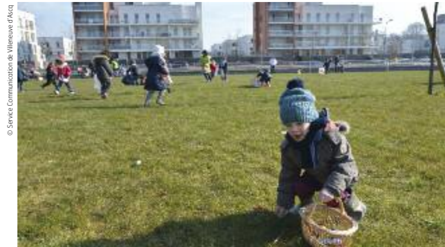
En 2020, 883 enfants ont fréquenté une structure municipale de la petite enfance.

La prise des rendez-vous pour les cartes d'identité et les passeports peut se faire directement en ligne via le site qui intègre un outil de gestion de la relation au citoyen, outil appelé à se développer et à