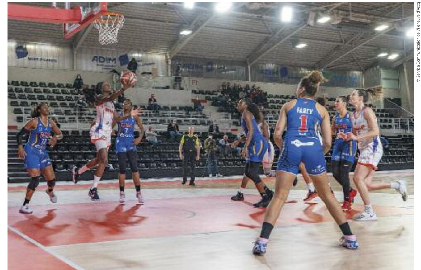
Les féminines de l'ESBVA.