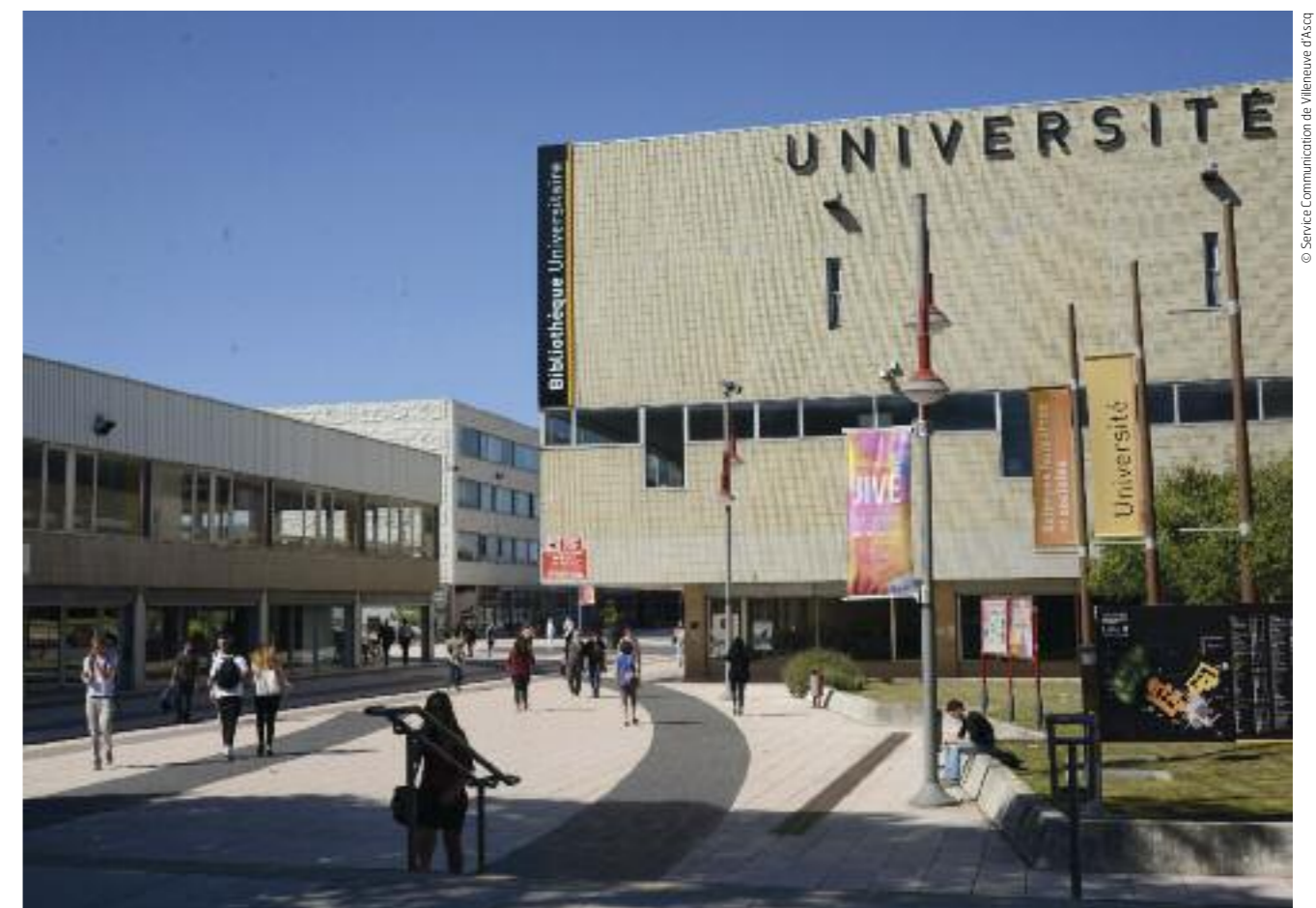
“Environ 45 000 étudiants viennent chaque jour étudier sur le territoire villeneuvois.”