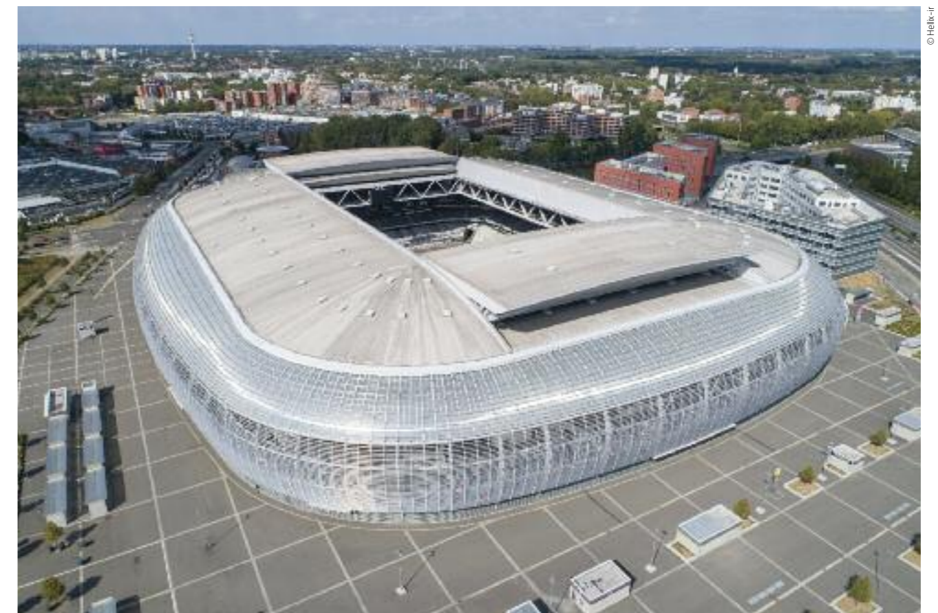
Le Grand Stade Pierre Mauroy.