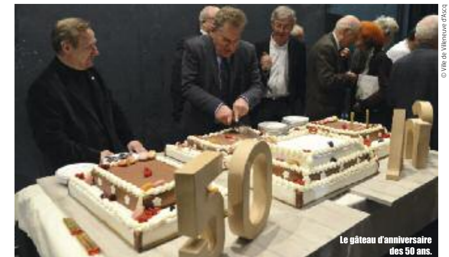
Le gâteau d'anniversaire des 50 ans.