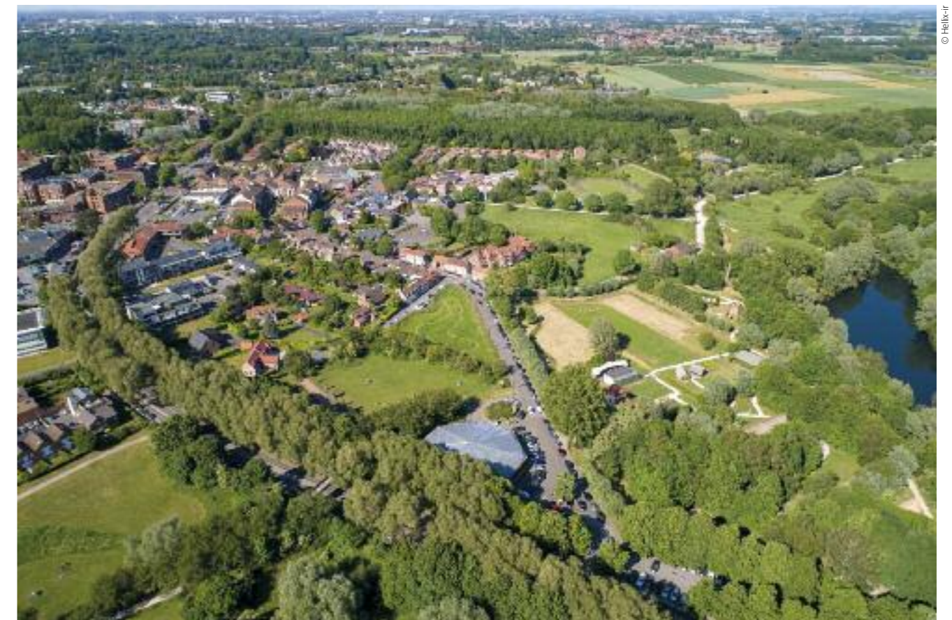
Une mairie constamment impliquée dans le quotidien des Villeneuvois.

Au Nord de la Ville, nous avons la réalisation d'un nouveau quartier : la Maillerie.