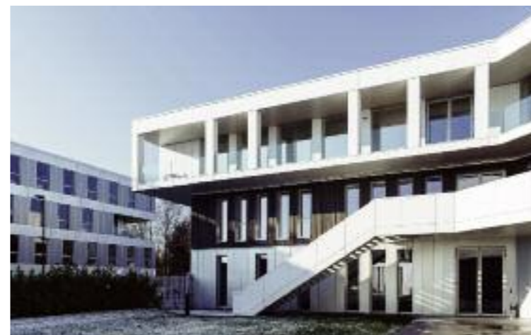
B1 - Villeneuve d'Ascq