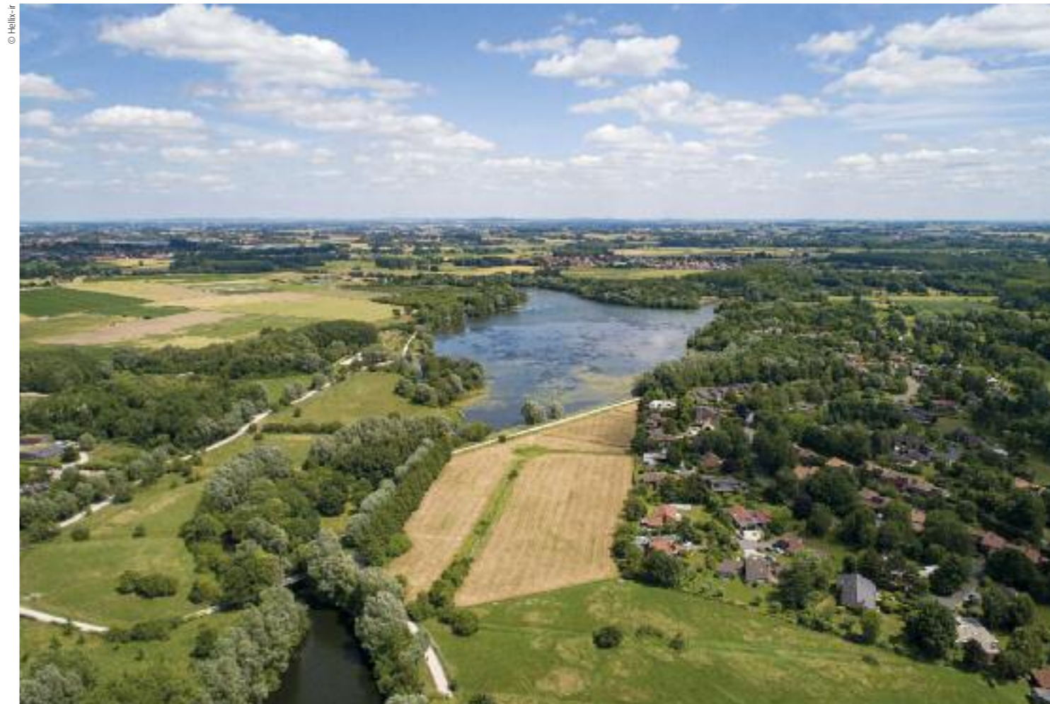
La trame verte et bleue : une continuité du corridor écologique tout au long de la chaîne des lacs.

Un système de primes municipales complet a été mis en place : isolation, chauffage