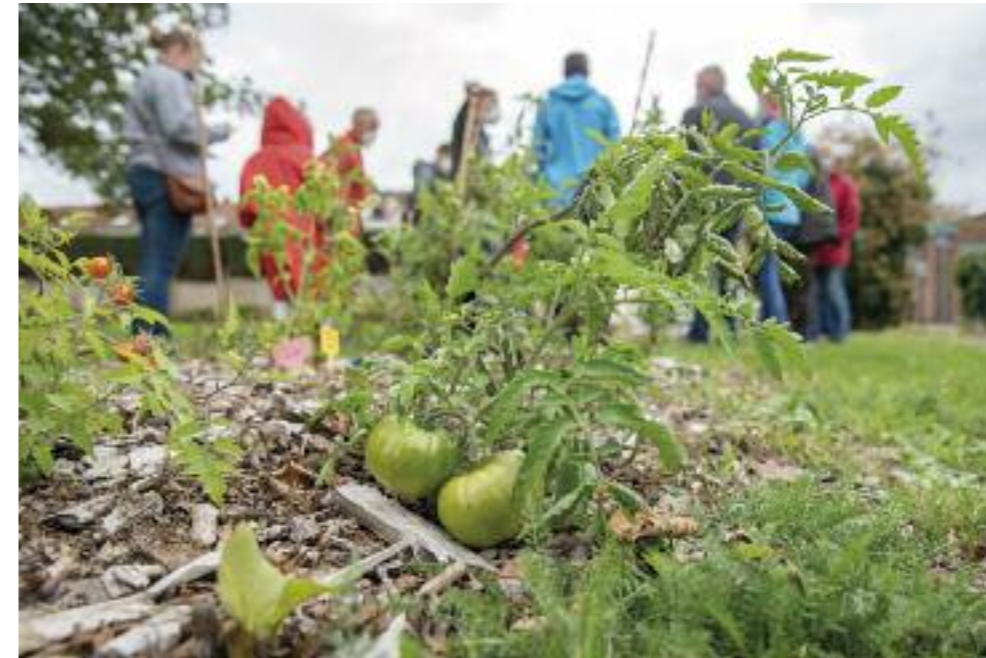
Les jardins de Cocagne : une initiative en faveur de l'économie durable.