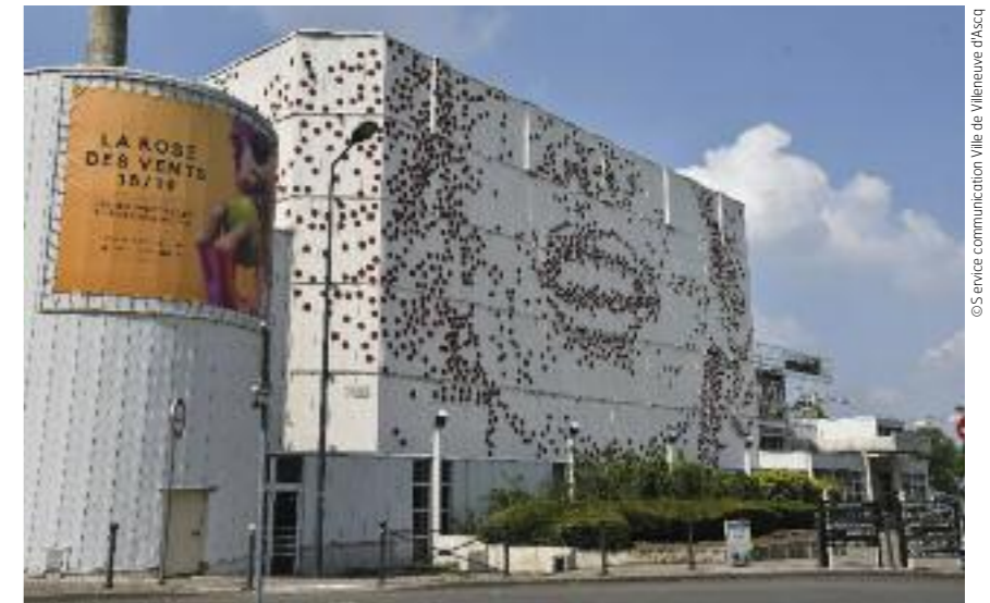
La Scène Nationale Rose des Vents réhabilitée pour 14 millions d'euros dont 7 pour la Ville répartis sur plusieurs exercices budgétaires.

Villeneuve d'Ascq doit faire face à pas mal de charges de centralité : gestion d'équipements qui concernent autant sinon plus les habitants de l'ensemble de la métropole que les Villeneuvois. Il en va ainsi et de façon criante pour la Scène nationale de la Rose des Vents dont 20 % seulement du public (en incluant les scolaires) sont originaires de Villeneuve d'Ascq. De façon moins spectaculaire également, les équipements nautiques. Villeneuve d'Ascq compte pas moins de deux piscines. C'est d'autant plus criant que la Ville pratique une tarification basse pour l'accès à ces équipements.