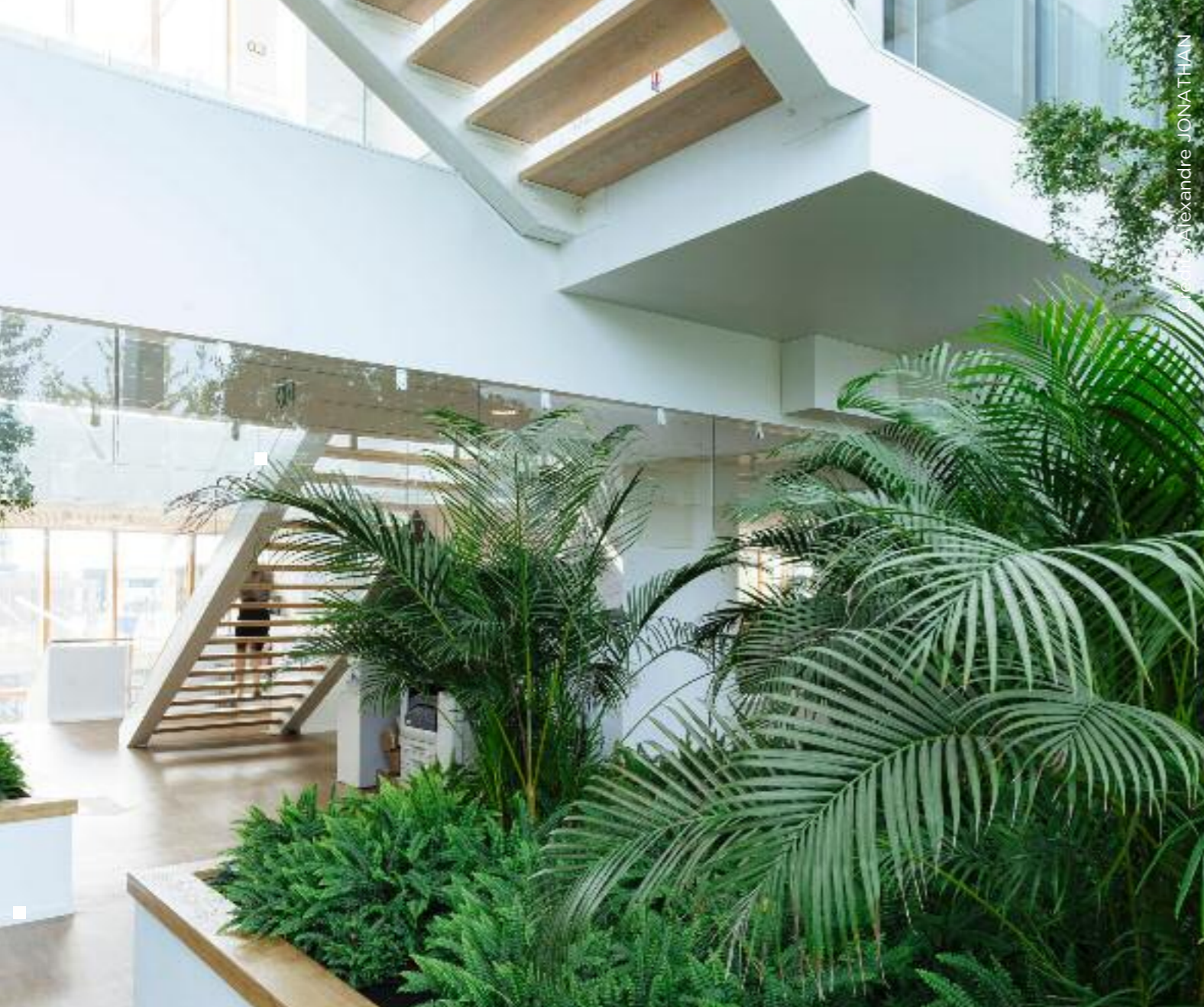
Parc Racine 2 - Siège de MCCAIN Europe - Villeneuve d'Ascq (59)

Sur le plan technique, elle possède un système inventif de traitement de l'eau via la chaîne des lacs et c'est ici qu'est né le VAL, acronyme de "Villeneuve d'Ascq-Lille" devenu ensuite "Véhicule Automatique Léger". Il s'agit du premier métro automatique au monde !