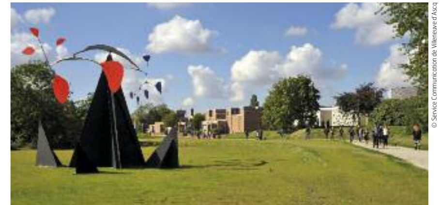
Le LAM, musée d'Art Moderne, d'Art Contemporain et d'Art Brut, emblème de la vie culturelle à Villeneuve d'Ascq.

Le salon Fossilium organisé à l'espace Concorde est l'une des bourses minéralogiques les plus importantes de France.