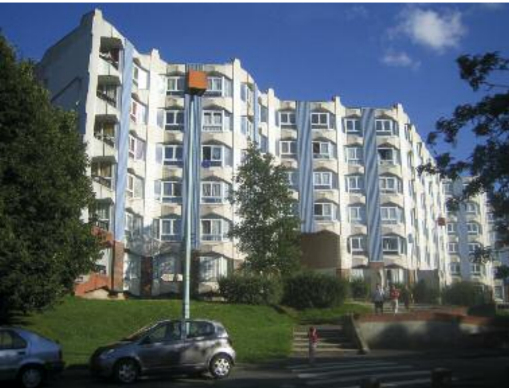
Le quartier du Triolo, cœur historique de l'aménagement de Villeneuve d'Ascq.