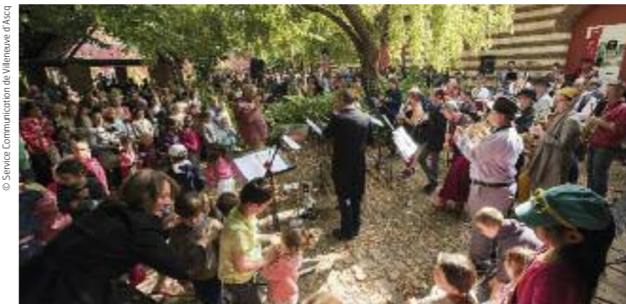
La Fête de la musique.