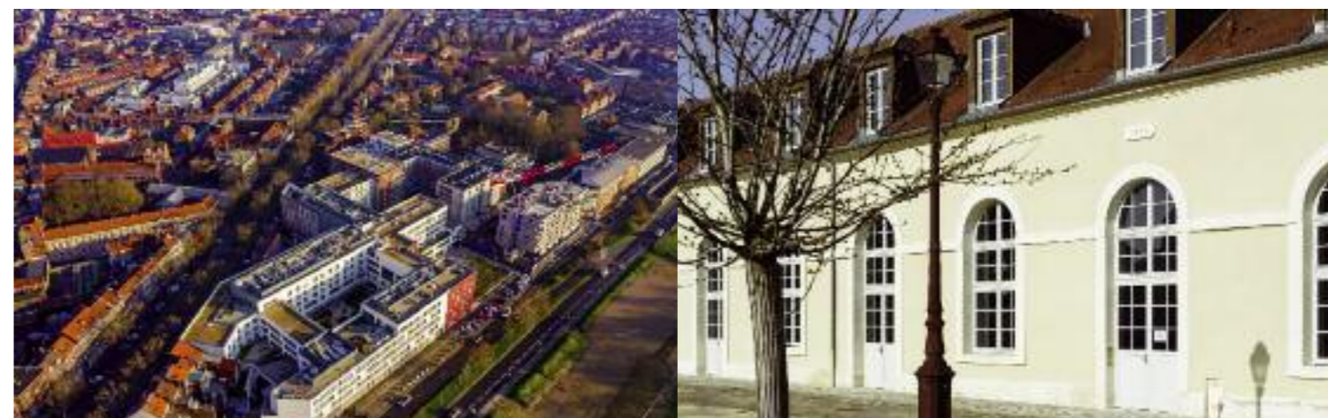
Iter Vitae - Lille