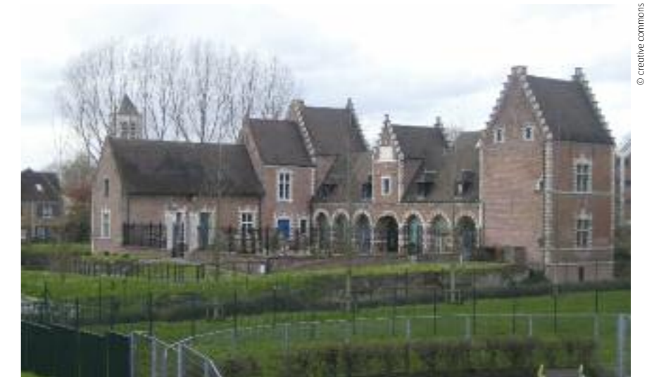
Le château de Flers : l'un des témoignages du Villeneuve d'Ascq d'avant la nouvelle ville.