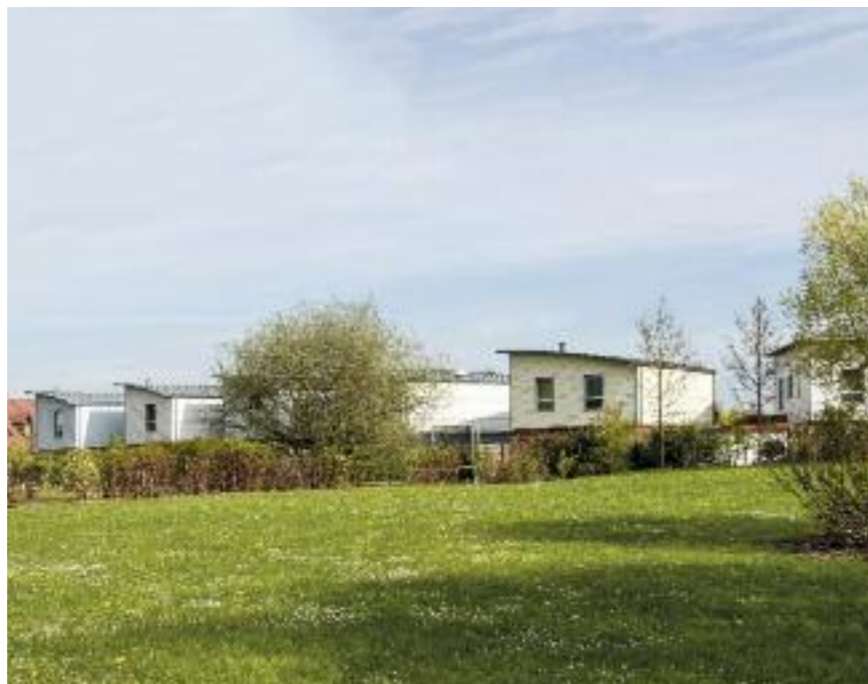
Le quartier de Recueil.