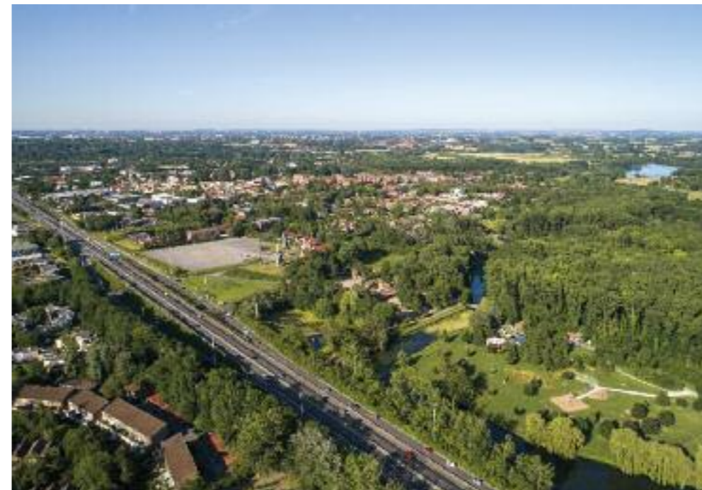
Villeneuve d'Ascq représente le deuxième pôle économique de la Métropole Européenne de Lille.