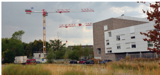
Villeneuve d'Ascq en tête de liste des 91 communes de la Métropole européenne de Lille pour l'immobilier de bureaux.

Et puis nous espérons relever un vieux défi : diminuer l'impact de la RN 227 (le boulevard du Breucq), gommer la cassure entre le Nord et le Sud de la ville. Si sa couverture relève de l'utopie, le maire bataille actuellement pour obtenir de la Mel le recentrage du flux automobile sur les quatre voies et la transformation des latérales en voies de desserte, en réintégrant la circulation des vélos, des piétons. Ce serait déjà une première étape. »