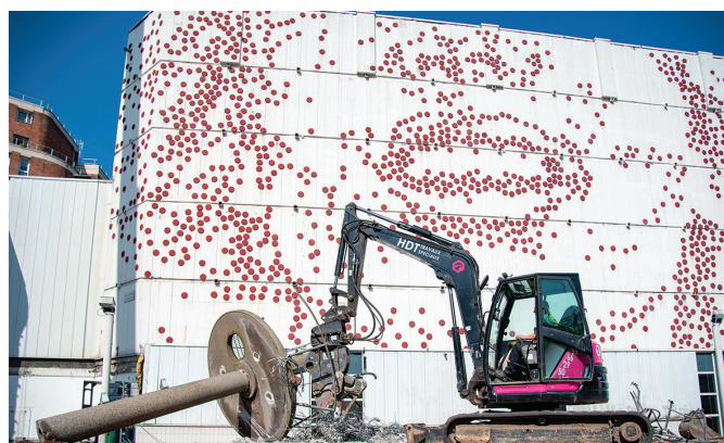
Les travaux de transformation entrent dans « le dur » en cette rentrée.

Le chantier. Après le désamiantage du bâtiment, le chantier passe la vitesse supérieure. D'ici 2024, la nouvelle « rose » de-