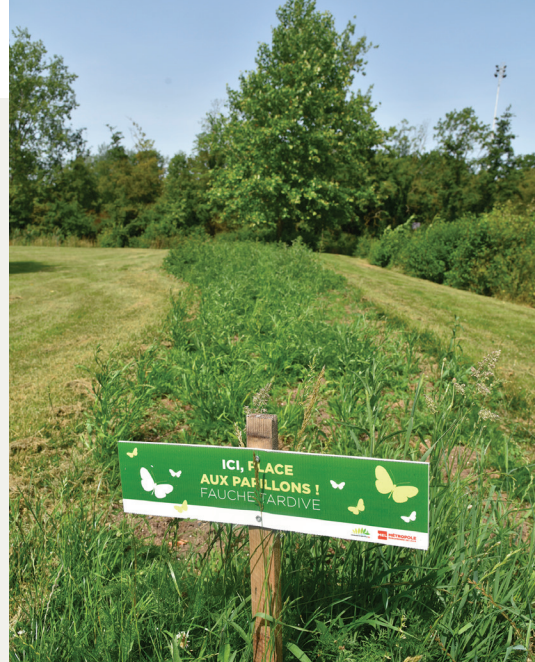
Dimanche à 11h, laissons-nous guider le long de la chaîne des lacs (ici au parc urbain).

Dragon de papier : samedi de 14h30 à 18h30 à la Villa Gabrielle, fabrication d'une marionnette de dragon en papier.