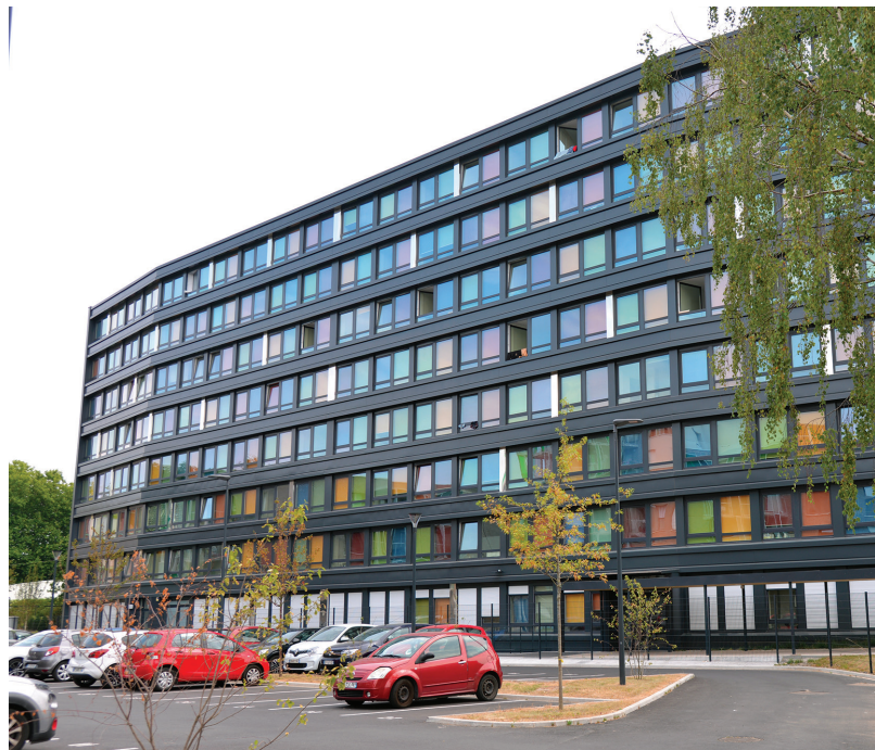
Un bel exemple de réhabilitation : la résidence étudiante rue Trémière, ancien bâtiment France Télécom.