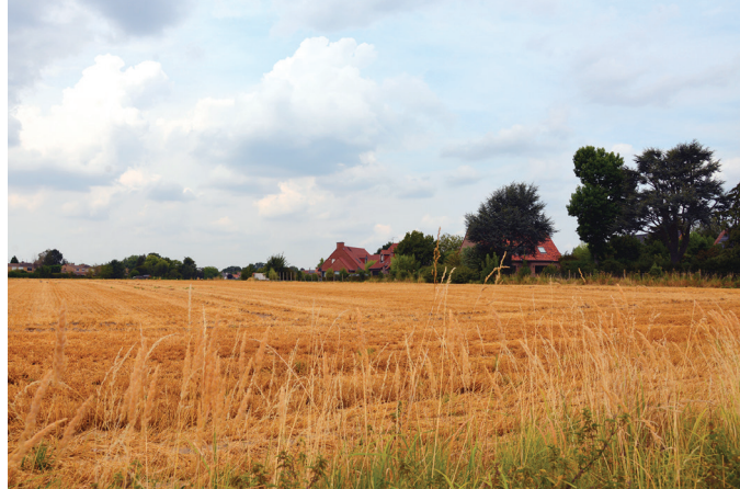
Dans le cadre de la modification du Plu, les élus ont sanctuarisé et rendu inconstructibles les terres agricoles.

Le Grenelle de l'environnement et la crise de l'énergie imposent aussi de construire des logements plus performants énergétiquement. La Ville intervient à sa manière, en incitant et en