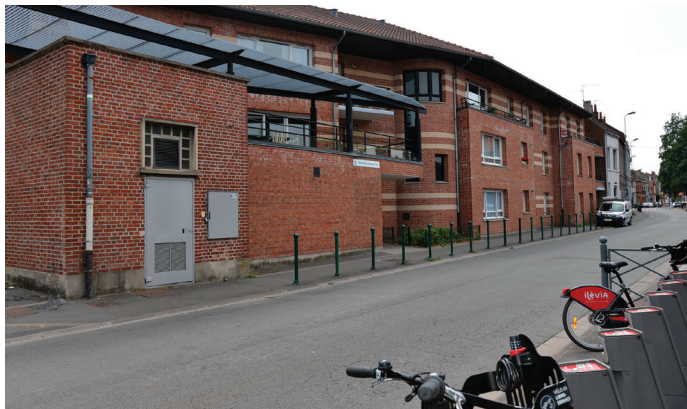
La Ville appuie des projets adaptés au quartier, à son environnement, aux besoins...

Certains secteurs peuvent encore être urbanisés, car au-delà de la politique de promotion immobilière, il y a aussi l'aménagement de l'espace public. Je travaille beaucoup avec Sébastien Costeur, conseiller municipal et métropolitain en charge des voiries, de l'assainissement, de la gestion des déchets, des circulations et des transports publics, pour qu'à chaque projet nouveau soient associés au préalable les aménagements nécessaires : anticiper la capacité de stationnement, les voiries, mais aussi essayer de rééquilibrer entre voiture, piéton, vélo. On est tous d'accord : il faut moins de voitures. Mais personne ne veut se contenter des mobilités douces... Si les nouvelles générations utilisent