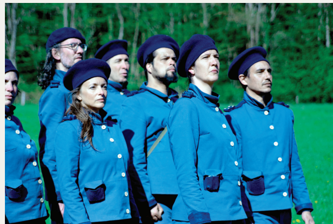
L'Armée du Chahut, samedi dans le quartier du Château. Moins stricte qu'elle ne paraît...