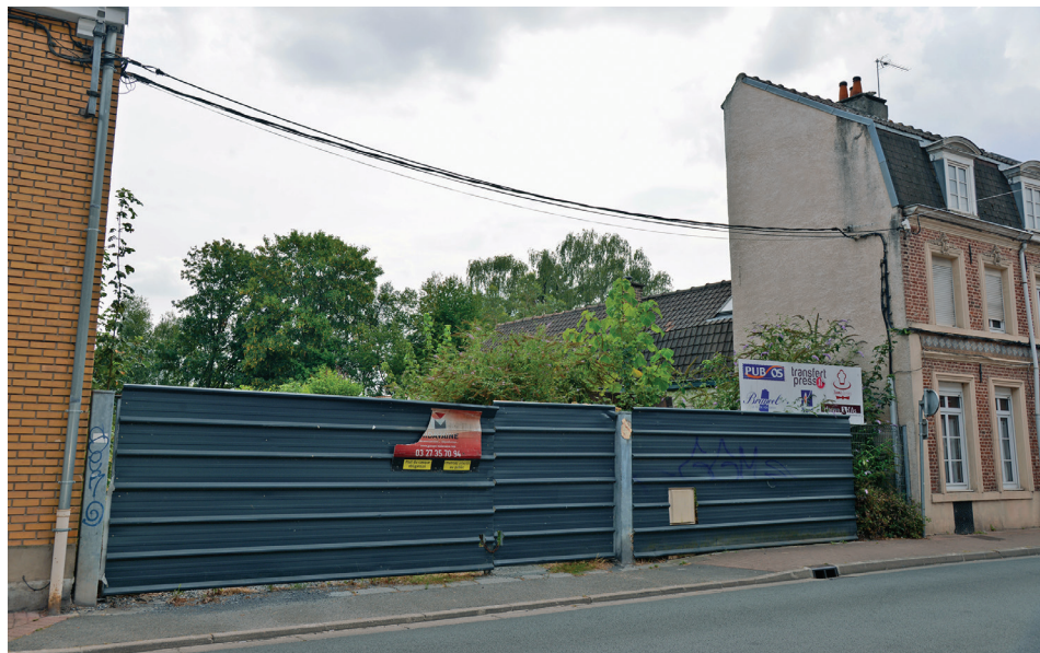
Offrir une seconde vie aux friches et aux « dents creuses » pour éviter l'étalement urbain.

En Centre-Ville, le site libéré à horizon 2024 par le magasin Leroy-Merlin accueillera lui aussi des logements, des commerces, du bureau et un espace végétal généreux en cœur d'îlot. Le boulevard de Tournai continue