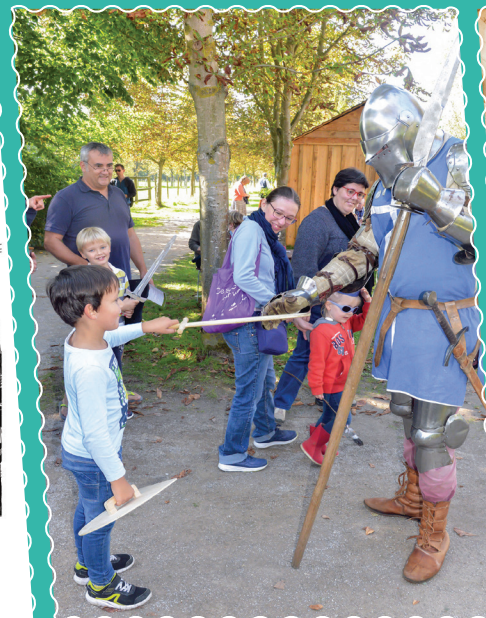
Le 11 septembre, des chevaliers au Musée de plein air,