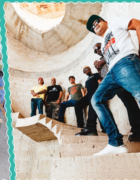
Le 6 octobre à la Ferme d'en Haut, Asian DubFondation