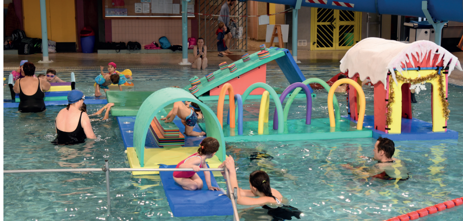
Les piscines ouvrent à tour de rôle l'été

• Les deux piscines municipales sont désormais ouvertes à tour de rôle durant l'été ; une décision basée sur des fréquentations moins élevées en juillet et août. La température de leur eau va également être abaissée d'un degré, ce qui permettrait à la Ville de réaliser une économie de chauffage, mais aussi de diminuer l'utilisation des produits désinfectants (une eau plus froide est moins sujette à bactéries).