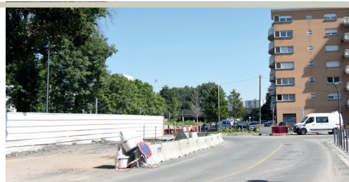
À la place de l'ancien centre social, le groupe Uxco construit une résidence pour étudiants de 221 logements.