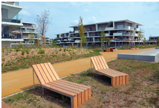
Le nouveau quartier Montalembert, où 400 logements ont été construits alors qu'il en était prévu 700.

« Pour chaque projet, une réunion est organisée avec présentation du projet par les promoteurs au conseil de quartier et aux riverains. La Ville reste neutre ; elle organise la concertation, rappelle les règles juridiques, les obligations des uns et des autres, ses services Droit des sols, Vie des quartiers et Voirie peuvent aussi appuyer des groupes de travail, mais elle ne prend pas position.