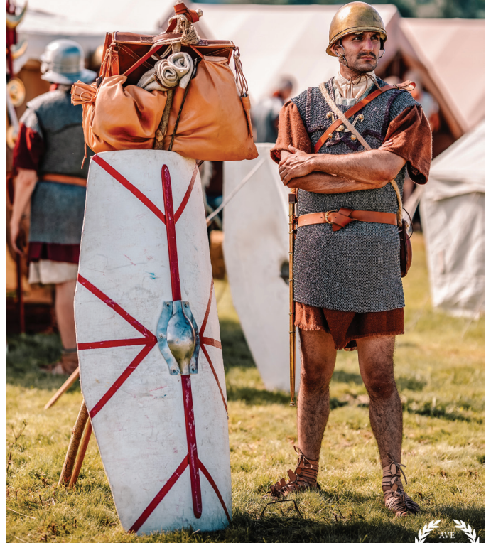
Le 11 septembre, découvrez le quotidien des légionnaires romains.

Bientôt les vacances d'automne : des stages accessibles aux