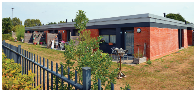
Proposer des logements adaptés à tous les âges de la vie, comme cette résidence pour aînés, dans le cadre du parcours résidentiel.